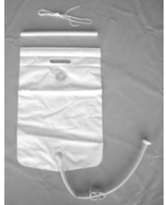
Σάκος νερού (Προαιρετικός)