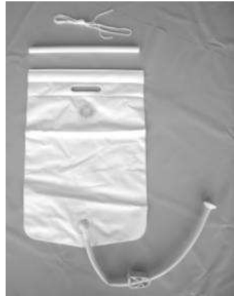
Water bag, optional