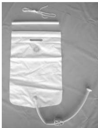
Σάκος νερού, προαιρετικός

Ο σάκος λουσίματος που απεικονίζεται είναι προαιρετικός (0806232)